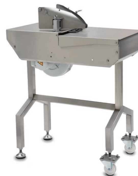
› Dispositif de gonflage de sac ABT

Schwalbenweg 24 D-33129 Delbrück, Allemagne Tél.: +49 (0) 5250.9843-0 Télécopie: +49 (0) 5250.9843-33 Site web: www.ghd.net Courriel: info@ghd.net