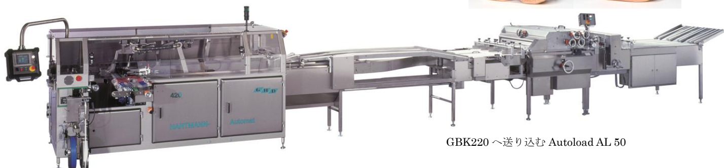
GBK220 へ送り込む Autoload AL 50